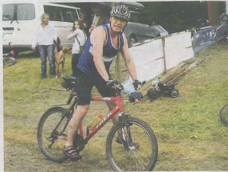
Osadu Výrov u Kladru letos obsadil rekordní počet závodníků. Na Výrovský triatlon přijelo 58 sportovců.

Fotografie ze závodu budou k vidění na www.cyklodrak.cz .